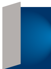
surcouv. 105 x 270 mm