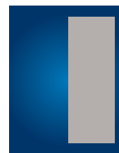
1/2 page H. 84 x 240 mm