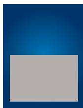
1/2 page L. 175 x 115 mm