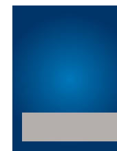
1/4 page L. 175 x 53 mm